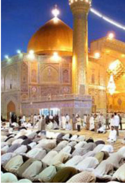
مرقد الإمام أمير المؤمنين