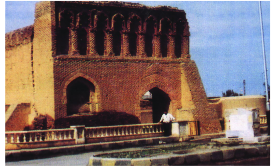
مشهد الإمام علي (عليه السلام)