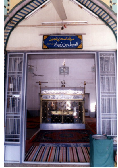
مرقد كميل بن زياد رحمه الله في الكوفة

ج : من آداب الدعاء أن يرفع الإنسان يديه تجاه وجهه نحو السماء-لأنه موضع نزول الرزق-؟؟ فإذا أكمل دعاءه مسح بيديه على وجهه وصدرة، وحيث إن الصلاة على النبي وآله (صلوات الله عليهم) هي نوع من أنواع الدعاء جرى عليها ذلك أيضاً.