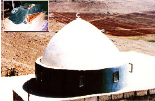
مرقد محمد بن أبي حذيفة في مغارة بجبل عالقين في الشام

ج : نعم ، تجعل لهم رأس سنة وتخمّس جميع ما عندهم - مما لم تخمّسه من قبل - رأس كل سنة.