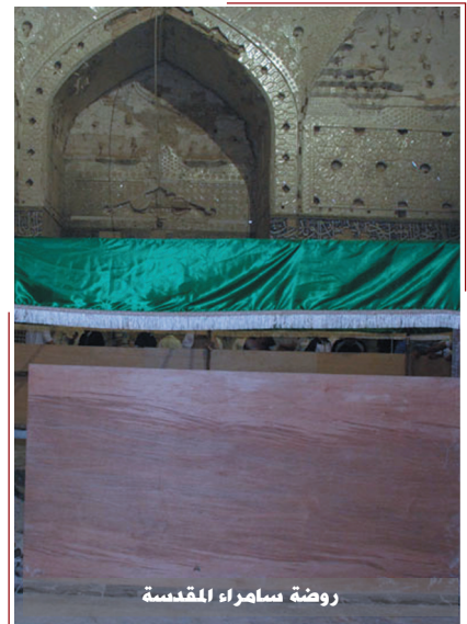
روضة سامراء المقدسة

قال الإمام محمد الباقر (عليه السلام): ينادي مناد من السماء باسم القائم فيسمع من بالشرق ومن بالمغرب، لا يبقى راقد إلا استيقظ، ولا قائم إلا قام على رجليه، فرزاً من ذلك الصوت، فرحم الله من اعتبر بذلك الصوت فأجاب، فإن الصوت الأول هو صوت جبرئيل الروح الأمين، وهو في شهر رمضان، شهر الله، ليلة الجمعة في الثالث والعشرين منه.