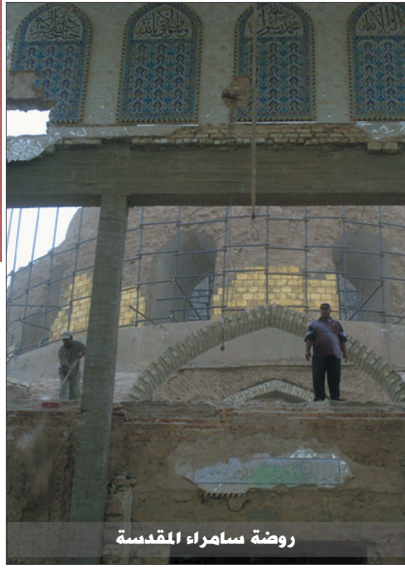
روضة سامراء المقدسة

البحرين : صـ بـ ١٩٢١ المنامة - البحرين هاتف ١٧٢٣-٢٣٢ فاكس ١٧٢٥٤٦٩٠ الكويت : صـ بـ ١١٩٨٩ الدسمه الرمز البريدي ٣٥١٦٠ الكويت هاتف ٢٥٥٢٥٦٠ فاكس ٢٥٥٢٥٧٠