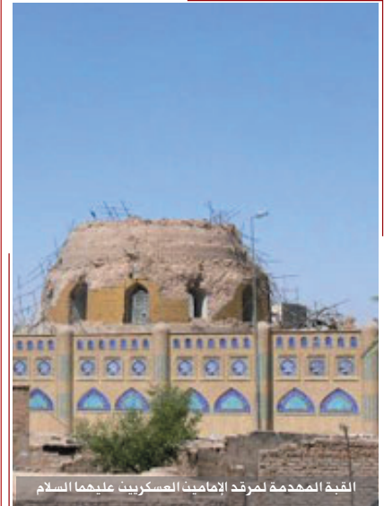
القبة المهدمة لمركز الإمامين العسكريين عليهما السلام