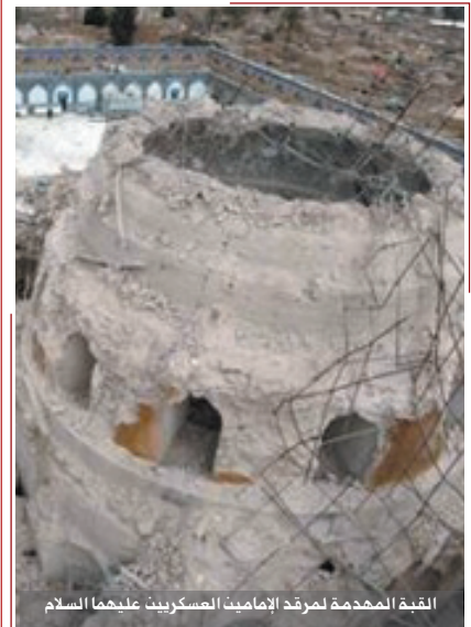
القبة المهدمة لمرقد الإمامين العسكريين عليهما السلام