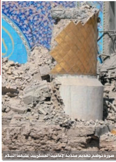
صورة توضح تدمير منحة الإمامين العسكريين عليهما السلام

أشهر على الجريمة الاولى، فحل العدوان الثاني، نعم لأننا لم نتحرك إعلاميا كما يجب، كان يفترض بنا إرسال ملايين الرسائل عبر البريد الالكتروني الى الأمم المتحدة ورؤساء الدول والمنظمات الحقوقية وكتابة سيل لا ينقطع من المقالات والبحوث في جرائد ومجلات العالم، واجراء اللقاءات والحوارات في الفضائيات وبشتى اللغات ..؟؟ والقيام بالتظاهرات والاعتصامات.