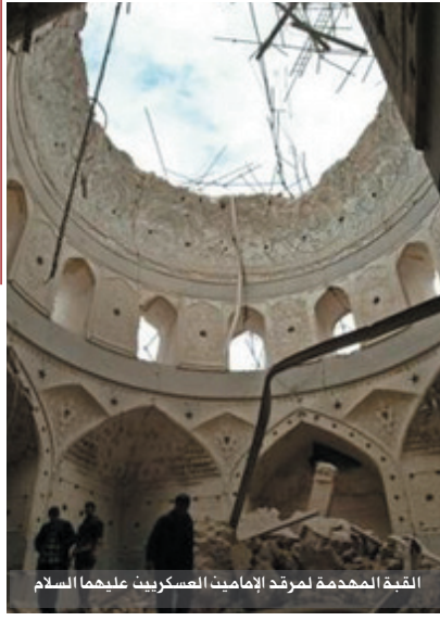
القبلة المهدمة لمرقد الإمامين العسكريين عليهما السلام

البحرين : صـ بـ ١٩٢١ المنامة - البحرين هاتف ١٧٢٣-٢٢٢ فاكس ١٧٢٥٤٦٩٠ الكويت : صـ بـ ١١٩٨٩ الدسمة الرمز البريدي ٣٥١٦٠ الكويت هاتف ٢٥٥٢٥٦٠ فاكس ٢٥٥٢٥٧٠