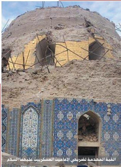
القبة المحمدية لضريح الإمامين العسكريين عليهما السلام